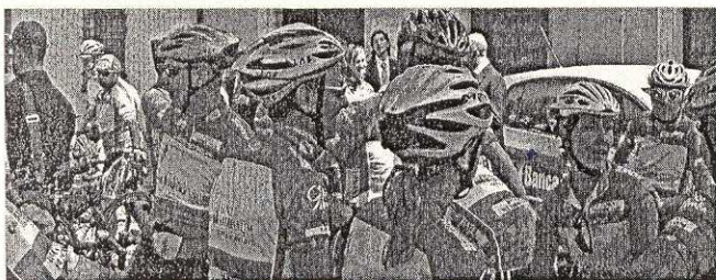
Clienti di Banca Mediolanum al Giro d'Italia 2006 davanti al Punto Mediolanum

In occasione del primo "Open Day" tenutosi lo scorso 11 novembre più di 17.000 persone hanno avuto l'occasione di conoscere il mondo Mediolanum e di provare il gusto di un nuovo modo di fare Banca. Ora con il 90° Giro d'Italia una nuova tappa si inserisce nella storia del Gruppo.