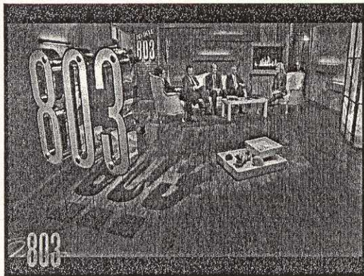
Lo studio di "Noi dell'803" durante la trasmissione condotta da Alessandra Appiano (a ds. Nella foto)