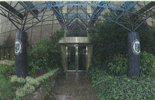
L'entrata della Mediolanum Corporate University a Milano Tre City