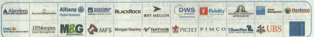
A titolo esemplificativo si riportano alcune delle società di investimento con le quali Mediolanum International Funds collabora.