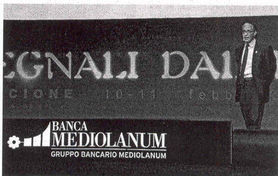
Il professor Ray Kurzweil durante il suo intervento al forum di Riccione

Ma l'apporto più importante di tutti è sicuramente quello rappresentato dal Family Banker, un professionista in grado di accompagnare il suo cliente lungo il viaggio più importante della sua vita: quello verso l'autonomia finanziaria nei lunghi anni liberi dal lavoro.