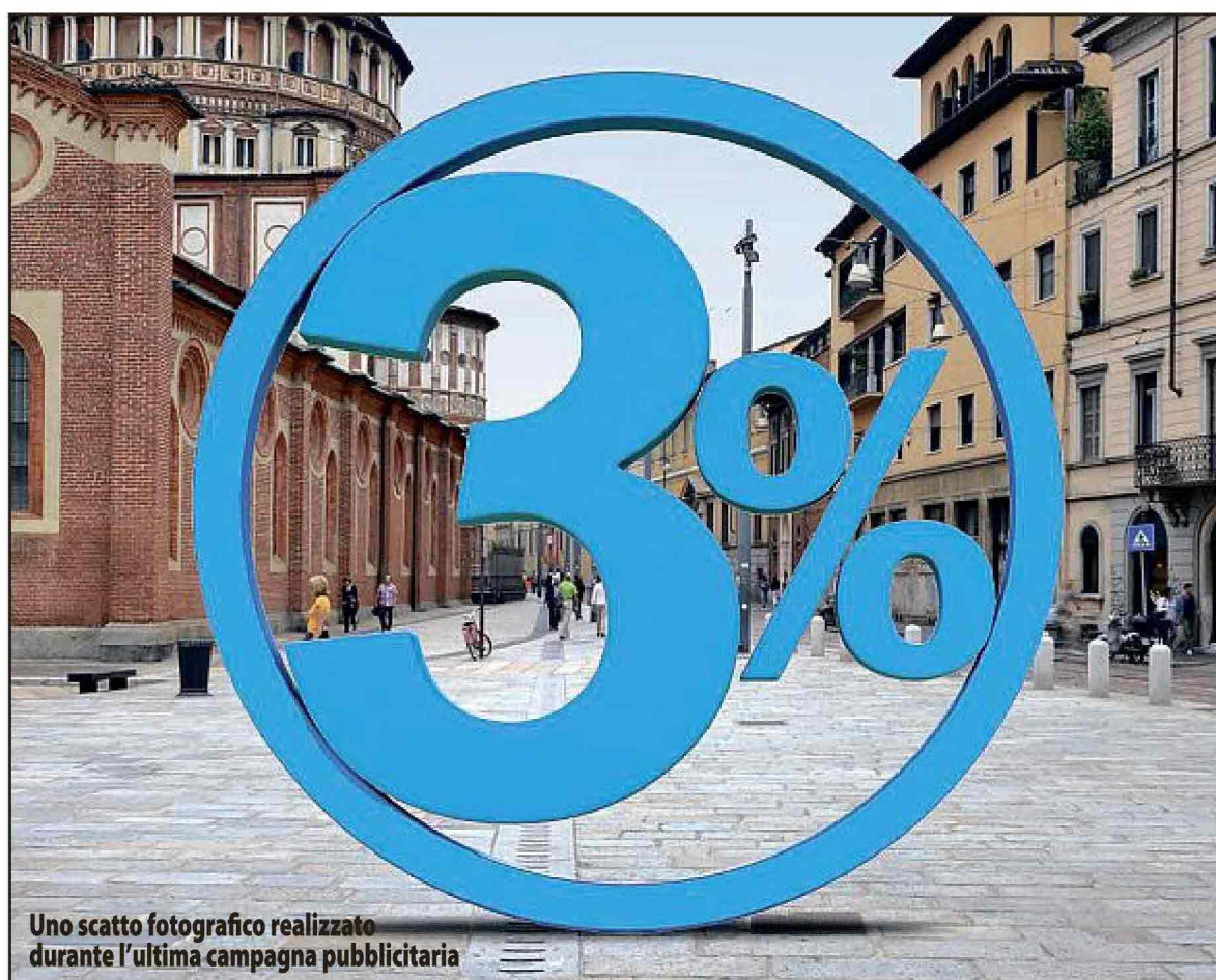
Uno scatto fotografico realizzato durante l'ultima campagna pubblicitaria

Ecco tutti i vantaggi di Mediolanum Freedom One e Mediolanum Freedom Più: oltre a un'operatività completa di conto corrente, alla possibilità di richiedere in fase di apertura del conto le carte di pagamento e il servizio Portaconto, che consente di trasferire gratuitamente in Banca Mediolanum gli investimenti, i bonifici e i pagamenti periodici dal vecchio conto corrente, tutti i nuovi clienti che aderiranno alla proposta dal 10 ottobre al 28 novembre 2013 avranno la possibilità di attivare un deposito a tempo con nuova liquidità della durata di 12 mesi al tasso di interesse molto conveniente e vantaggioso del 3% lordo annuo, riconosciuto sul conto con anticipi trimestrali. E, sempre a proposito di tempistica, è anche importante sottolineare che, sui conti Freedom One e Freedom Più aperti entro il 31 dicembre 2013, i clienti avranno la possibilità di avere la carta di credito FreedomCard Advanced (appoggiata al medesimo conto e richiesta entro la medesima data)