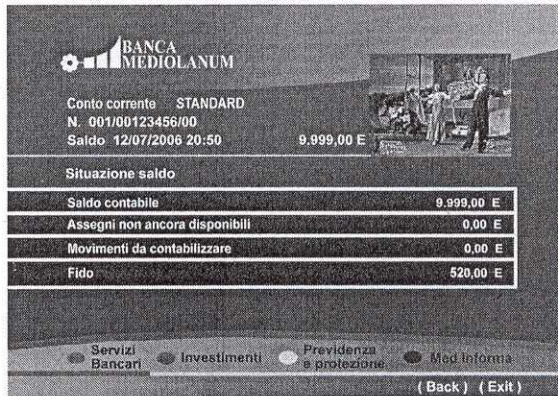
Una schermata di Banca Mediolanum sul digitale terrestre

clienti tutte le novità dell'offerta della Banca. Per qualunque problema e chiarimento è inoltre possibile ricorrere al Servizio Clienti di Banca Mediolanum al numero verde 800.107.107 presso cui è attivo un team di supporto per il T-Banking in grado di gestire tutte le istanze dei clienti.