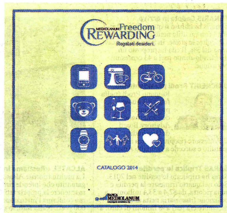
La copertina del catalogo di Mediolanum Freedom Rewarding

È importante che ogni cliente e risparmiatore dedichi attenzione e tempo adeguato a confrontare proposte e offerte, a valutarne condizioni e differenze, spesso sostanziali, a scegliere quelle più convenienti e vantaggiose per lui. La differenza importante non è circoscritta a 100 o 200 euro di convenienza tra un'offerta e l'altra, ma si estende all'intero servizio e alla sua qualità: alla qualità del rapporto tra banca e cliente. Per questo, è importante scegliere la banca "giusta". Che non è più la banca più vicina a casa come lo