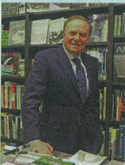
Ennio Doris, Presidente di Banca Mediolanum

Credo che chi non farà questo, in futuro, non si mangerà solo le unghie, ma le dita delle mani, le mani e le braccia.