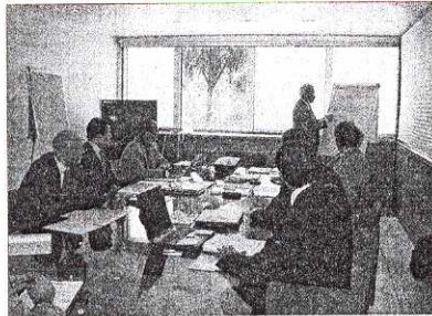
Un gruppo di consulenti durante un corso di formazione

In tema di strumenti di comunicazione va evidenziato il peso attribuito agli spot pubblicitari: in particolare la banca oltre alla pubblicità su carta stampata e tv sta insistendo anche su quella online, considerando che il ricorso all'home banking sta assumendo, anche fra gli italiani, i caratteri di un fenomeno di massa. Infine l'attività di sponsorizzazione e, quindi di marketing del brand, sostenendo svariate manifestazioni (da quelle sportive a quelle culturali) anche a livello locale.