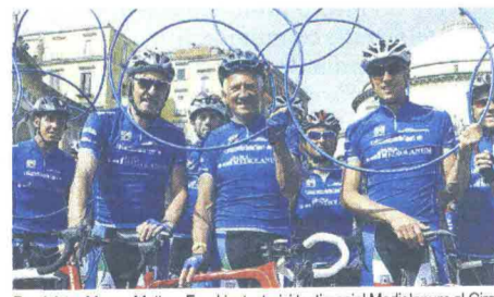
Da sinistra Moser, Motta e Fondriest, storici testimonial Mediolanum al Giro

Per il tredicesimo anno consecutivo Banca Mediolanum è salita in sella prendendo parte alla 98esima edizione del Giro d'Italia, partenza da Sanremo il 9 maggio. E lo ha fatto ancora una volta come sponsor del Gran Premio della Montagna con la maglia azzurra, dedicata al miglior "scalatore", simbolo di italianità ma non solo: anche di impegno, sacrificio, e forza del singolo individuo ma allo stesso tempo della capacità di fare squadra e del lavoro di gruppo. Concetti in profonda sintonia con i valori e la filosofia sui quali poggia l'esperienza di Banca Mediolanum. Come sempre, anche per l'edizione 2015 la presenza di Banca Mediolanum al Giro d'Italia, che si concluderà a Milano il 31 maggio, sarà arricchita da pranzi esclusivi su invito lungo il percorso, cene di gala in location di eccezione, pedalate amatoriali e tante altre iniziative parallele alla ma-