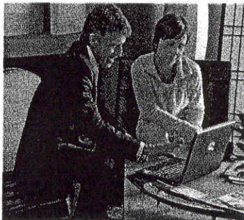
I Family Banker, consulenza di fiducia