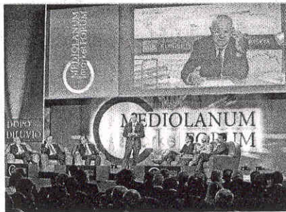
Banca Mediolanum nel 2009 ha realizzato circa 2 mila eventi che hanno richiamato oltre 150 mila persone. Qui sopra, un'immagine del Mediolanum Market Forum, il convegno economico-finanziario organizzato presso la Borsa di Milano

Group Manager (ovvero direttore commerciale di Banca Mediolanum). Circa 2 mila gli eventi organizzati nel 2009, culturali, sportivi, di intratteni-