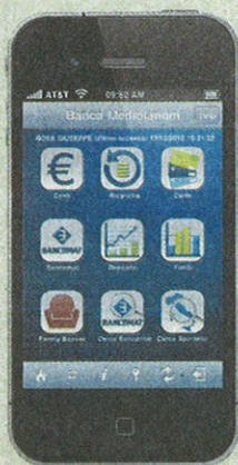
L'accesso a Banca Mediolanum in mobilità è del resto disponibile sin dal 2007,

vo del contante, e gli uffici dei Family Banker. L'applicazione si completa con la possibilità di visualizzare i riferimenti del proprio Family Banker come il numero di cellulare, l'indirizzo e-mail e dell'Ufficio. Nei primi dieci giorni dalla pubblicazione dell'applicazione si sono registrati più di 5 mila «download» e circa 9 mila accessi. La nuova applicazione per iPhone e iPod Touch rappresenta un ulteriore tassello tecnologico del modello multicanale che da sempre contraddistingue Banca Mediolanum.