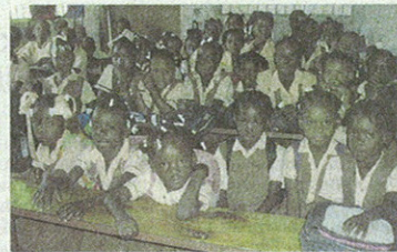
Da anni il Gruppo Mediolanum e la sua Fondazione sostengono iniziative per i bambini di Haiti

Un'altra sostanziale caratteristica che differenzia e distingue il conto corrente Freedom è poi l'opportunità, e il merito, di contribuire – con ogni nuovo conto corrente aperto – a un'importante missione umanitaria e di solidarietà, a favore dei