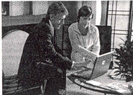
Family Banker, consulenza a ogni cliente

Quella del Family Banker è una professione unica nel panorama bancario italiano. Il modello e l'organizzazione di Banca Mediolanum consentono a chi ha le caratteristiche ottime soddisfazioni economiche e di carriera, e i risultati finanziari ottenuti, anche in un periodo non facile come quello che stiamo attraversando, rappresentano la migliore 'cartina di tornasole', la migliore prova finale del funzionamento e dell'efficienza di un modello bancario e di un'attività professionale. Mentre tutte le altre banche hanno filiali e sportelli tradizionali, dove l'assistenza e la consulenza personale al cliente sono ancora standardizzate e superficiali, oppure il servizio viene fornito attraverso piattaforme online, dove il contatto diretto è del tutto inesistente, il Family Banker rappresenta il fulcro e l'anello di congiunzione tra Banca Mediolanum e tutti i suoi clienti in ogni parte d'Italia, dalle grandi città ai piccoli centri di provincia. In questo modo ogni cliente può contattare il Banking center o