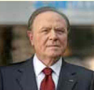
di Ennio Doris*

Siamo alla vigilia di una svolta epocale. Banca Mediolanum è pronta per accompagnare i suoi clienti a coglierne le opportunità. La svolta nasce dalla tecnologia che, da quando esiste, sempre sovverte l'ordine in una specie di rivoluzione silenziosa ma inarrestabile. A darle una accelerazione è stata la crisi finanziaria e poi economica.