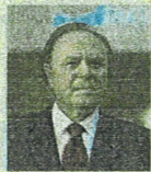
di Ennio Doris*

Si può ancora investire con sicurezza? È questa la domanda che si pone la maggioranza dei risparmiatori. La risposta è sì, non perché ignoriamo i rischi dei mercati, anzi perché li conosciamo molto bene, e sappiamo perciò gestirli.