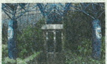
L'ingresso della Mediolanum Corporate University (MCU) a Milano.

scano i consumi, le aziende riorganizzate e snellite durante la crisi lavorano a pieno ritmo e sono piene di soldi da impiegare come mai in precedenza, i reinvestimenti negli ultimi sei mesi sono aumentati del 60% rispetto a un anno fa. Quest'anno la crescita economica sarà del 3,5%, a due cifre il rendimento dei titoli azionari. Sono in fase di espansione i settori energia, tecnologia, servizi sanitari. La notizia che la convalescenza del mercato azionario ameri-