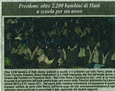
Oltre 2.200 bambini di Haiti stanno andando a scuola, e ci andranno per tutto l'anno, grazie al Conto Corrente Freedom. Banca Mediolanum si è infatti impegnata, alla fine dell'estate scorsa, a versare alla Fondazione Francesca Rava - N.P.H. Italia Onlus il contributo per i costi di un mese di scuola di un bambino dell'isola caraibica per ogni nuovo conto Freedom sottoscritto tra il primo ottobre 2010 e il 31 marzo 2011. Nel segno della massima concretezza e trasparenza di questo impegno solidale da parte della Banca, sull'home page del sito www.bancamediolanum.it ogni settimana viene pubblicato e comunicato il dato aggiornato dei risultati raggiunti.

collegato: per ogni nuovo Conto Freedom, aperto dal primo ottobre scorso fino al prossimo 31 marzo, Banca Mediolanum garantirà un mese di scuola a un bambino di Haiti, sostenendo le attività della Fondazione Francesca Rava N.P.H. Italia Onlus, in stretta collaborazione con Fondazione Mediolanum. Un'iniziativa che, attraverso la sovvenzione a carico esclusivamente della Banca e non del correntista, dall'inizio di ottobre 2010 ha già permesso di donare a oltre 2.200 bambini haitiani la possibilità di frequentare la scuola per un intero anno. In sostanza, convenienza, vantaggi e solidarietà, insieme in un conto corrente.