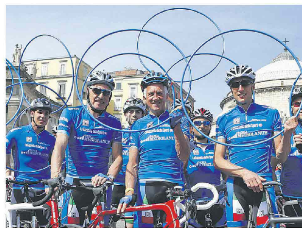
Da sinistra Moser, Motta e Fondriest, storici testimonial Mediolanum al Giro

È lo ha fatto ancora una volta come sponsor del Gran Premio della Montagna con la maglia azzurra, dedicata al miglior "scalatore", simbolo di italianità ma non solo: anche di impegno, sacrificio, e forza del singolo individuo ma allo stesso tempo della capacità di fare squadra e del lavoro di gruppo. Concetti in profonda sintonia con i valori e la filosofia sui quali poggia l'esperienza di Banca Mediolanum. Come sempre, anche per l'edizione 2015 la presenza di Banca Mediolanum al Giro d'Italia, che si concluderà a Milano il 31 maggio, sarà arricchita da pranzi esclusivi su invito lungo il percorso, cene