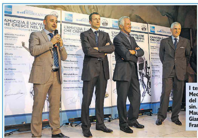
I testimonial Mediolanum del Giro 2014: da sin. Paolo Bettini, Maurizio Fondriest, Gianni Motta, Francesco Moser

valori sui quali si fonda la strategia e la forza stessa di Banca Mediolanum, che grazie alla propria squadra di lavoro riesce a rispondere ed esaudire i