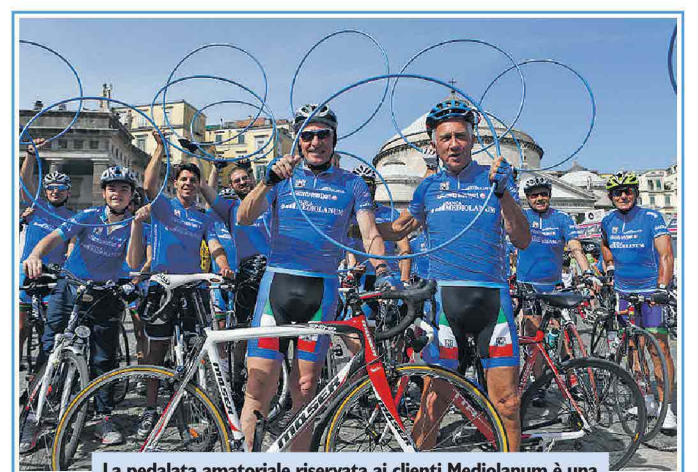
La pedalata amatoriale riservata ai clienti Mediolanum è una delle iniziative tradizionali della Banca legate al Giro d'Italia

Cene riservate che nel corso di questa edizione, per la prima volta, saranno arricchite da un set fotografico dove gli ospiti potranno posare con i testimonial storici di Banca Mediolanum: Francesco Moser, Gianni Motta, Maurizio Fondriest e Paolo Bettini, e portarsi a casa la foto-ricordo della serata. Sempre in compagnia dei testimonial, prose-