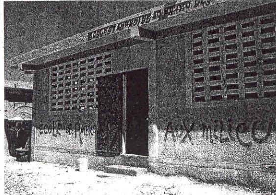
Da anni la Fondazione Mediolanum opera ad Haiti a sostegno dell'infanzia. Qui sopra, una delle scuole realizzate

Purtroppo non si hanno ancora notizie certe sulle strutture all'interno degli 'slums' realizzate da Fondazione Mediolanum, ma in questo momento l'emergenza è soprattutto sanitaria e assistenziale.