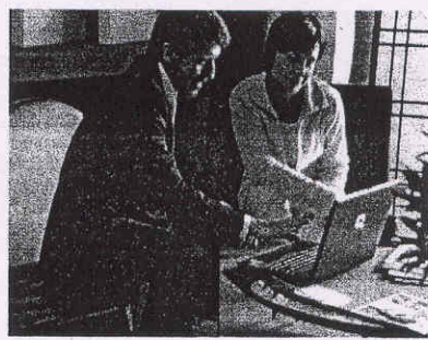
Consulenza finanziaria specializzata con i Global Banker Mediolanum