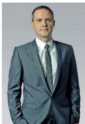
Massimo Doris, amministratore delegato di Banca Mediolanum.

Il rapporto banca-cliente nasce per la maggior parte dei casi con l'apertura del primo conto corrente e spesso dura tutta una vita solo perché non si ha il tempo di cercarne uno migliore e più adatto alle nostre aspettative o, peggio, perché non si ha voglia di addentrarsi in temi che sembrano troppo tecnici e poco accessibili. Ma se fino a qualche anno fa vigevano le opinioni comuni che "tutte le banche sono uguali tanto vale dunque scegliere quella sotto casa", e che "mettere i soldi in banca è sinonimo di sicurezza e garanzia", oggi le cose sono sostanzialmente cambiate. Le cronache degli ultimi anni e il perdurare della crisi finanziaria hanno portato alla luce un aspetto fondamentale: la banca è un attore troppo importante nella nostra vita per essere scelta con criteri approssimativi e allo stesso tempo il mercato è ricco di soluzioni valide e solide verso cui indirizzare i propri risparmi. Vale dunque la pena ritagliarsi del tempo per verificare se la banca cui stiamo affidando i nostri soldi sia solida e in salute. Come farlo? Controllando determinati criteri che nel complesso indicano lo stato di salute della banca stessa: innanzitutto la sua solidità patrimoniale (espressa dal Core Tier1) e il conto economico, che permette di verificare se la banca è in utile e dunque più sicura e in grado di redistribuire i suoi guadagni ai clienti sotto for-