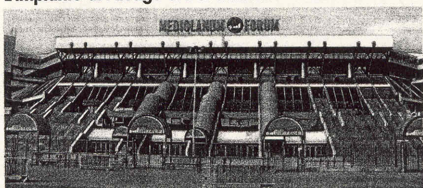
Il Forum di Assago ha un nuovo nome, Mediolanum Forum. Il «battesimo» segna l'entrata in scena di una nuova «madrina», Banca Mediolanum, che sarà lo sponsor per i prossimi tre anni. Undicimila spettatori agli incontri sportivi, tredicimila durante i concerti: è questa la capienza di uno dei più bei palazzi dello Sport, situato alle porte di Milano Sud, punto di riferimento e di attrazione per tutta la regione.