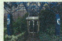
L'ingresso della Mediolanum Corporate University (MCU) a Milano

La notizia che la consapevolezza del mercato azionario americano è termina-