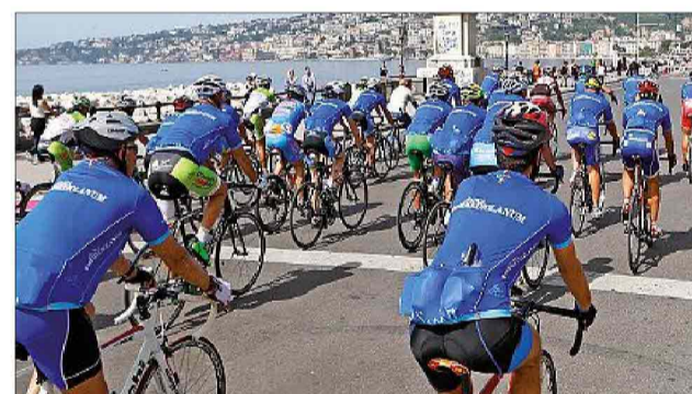
La pedalata amatoriale riservata ai clienti Mediolanum è una delle iniziative tradizionali della Banca legate al Giro d'Italia

deri dei propri clienti. Come ogni anno anche per l'edizione 2014 la presenza di Banca Mediolanum al Giro d'Italia, che si concluderà a Trieste il prossimo 1º giugno, sarà arricchita da avvenimenti paralleli alla gara e da piacevoli occasioni di incontro: da pranzi esclusivi su invito lungo il percorso delle tappe più emozionanti alle cene di gala in location d'eccezione. Cene riservate che nel corso di questa edizione, per la prima volta, saranno arricchite da un set fotografico dove gli ospiti potranno posare con i testimonial storici di Banca Mediolanum: Francesco Moser, Gianni Motta, Maurizio Fondriest e Paolo Bettini, e portarsi a casa la foto-ricordo della serata. Sempre in compagnia dei testimonial, proseguono anche per il 2014 le "pedalate" amatoriali in partenza e in arrivo di tappa, che nel 2013 hanno visto la partecipazione di oltre 1.000 appassionati; e l'accoglienza nelle aree hospitality da dove clienti e appassionati, esclusivamente su invito, potranno vivere da vicino l'emozionante arrivo al traguardo. Ampio