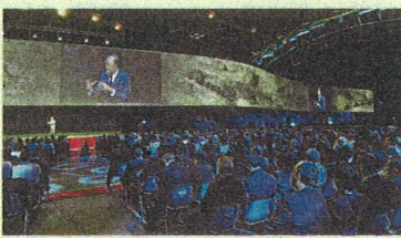
Un'immagine dell'evento di Rimini per il Family Banker Mediolanum

rispettivamente 2,30% annuo lordo (1,68% netto), e 1,80% annuo lordo (1,31% netto). InMediolanum affianca Conto Freedom, punta di diamante di Banca Mediolanum, arricchendo ulteriormente una gamma di servizi bancaria ampia, completa e in continua evoluzione. Basti pensare alle recenti novità introdotte nell'offerta come il servizio di Pronti Contro Termine con rinnovo automatico, "E Così" - una soluzione bancaria per i più giovani,