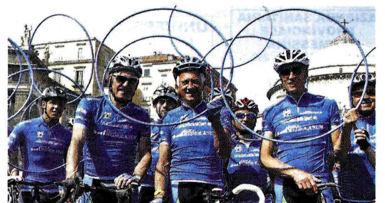
Da sinistra Moser, Motta e Fondriest, storici testimonial Mediolanum al Giro

Per il tredicesimo anno consecutivo Banca Mediolanum è salita in sella prendendo parte alla 98esima edizione del Giro d'Italia, partenza da Sanremo il 9 maggio. E lo ha fatto ancora una volta come sponsor del Gran Premio della Montagna con la maglia azzurra, dedicata al miglior "scalatore", simbolo di italianità ma non solo: anche di impegno, sacrificio, e forza del singolo individuo ma allo stesso tempo della capacità di fare squadra e del lavoro di gruppo. Concetti in profonda sintonia con i valori e la filosofia sui quali poggia l'esperienza di Banca Mediolanum. Come sempre, anche per l'edizione 2015 la presenza di Banca Mediolanum al Giro d'Italia, che si concluderà a Milano il 31 maggio, sarà arricchita da pranzi esclusivi su invito lungo il percorso, cene di gala in location di eccezione, pedalate amatoriali e tante altre iniziative parallele alla manifestazione sportiva caratterizzate dalla presenza di testimonial d'eccezione tra i quali Francesco Moser (dal 2003), Gianni Motta (dal 2004), Maurizio Fondriest (dal 2004) e Paolo Bettini (dal 2010). Un insieme di eventi creati ad hoc che gli anni hanno attirato decine di migliaia di persone e che sono stati quotidianamente seguiti e documentati sui principali