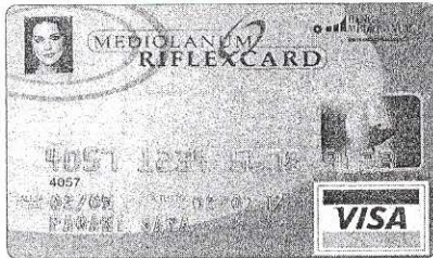
La Reflexcard personalizzata

Per buona parte degli italiani il rapporto con la propria banca continua ad essere conflittuale e difficile. Tanto che uno su tre, per le questioni finanziarie, preferisce operare in autonomia, facendo addirittura a meno di rivolgersi a un istituto di credito (il 32% degli italiani non farebbe uso di una banca, mentre il 54% ne utilizza una sola). In base, infatti, alla recente indagine pubblicata dalla stampa specializzata, sono ancora troppi i clienti che nutrono insoddisfazione e poca fiducia nei confronti della propria banca. Ma non è tutto. L'inchiesta mostra gli italiani come un popolo in prevalenza "mono-bancario" che per giunta, in genere, esaurisce la propria attività con l'apertura di un unico conto corrente (solo il 7% detiene oltre al conto corrente, investimenti e finanziamenti). Il gap è sul piano della trasparenza. La clientela, e in particolare l'affluente, quella di fascia patrimoniale più alta, chiede cioè maggior precisione e chiarezza nei rapporti che intercorrono con la banca.