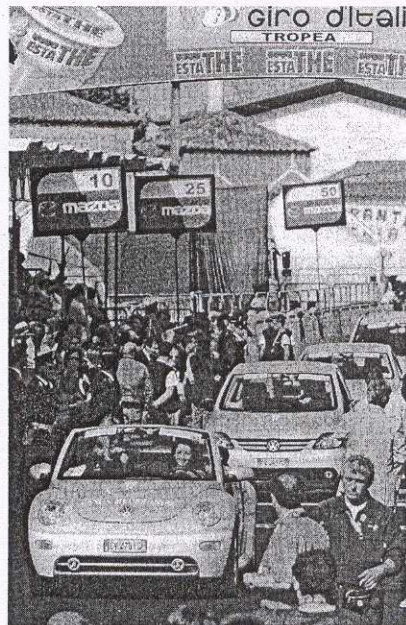
La carovana di Banca Mediolanum al Giro d'Italia 2005

Alla sera poi i Mediolanum party. Verrà infatti ripetuta l'esperienza della passata edizione: nella cornice delle località che ospitano le varie tappe, la banca porterà a cena i migliori clienti della zona, ospiti dei ristoranti più esclusivi, dove con big dello sport, filmati sul tema e musica live si entrerà giorno dopo giorno sempre più nel vivo dell'atmosfera del Giro.