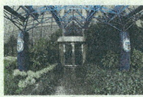
L'entrata della Mediolanum Corporate University a Besiglio (Milano)