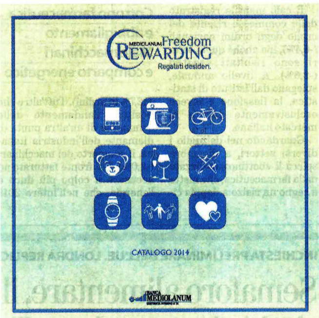
La copertina del catalogo di Mediolanum Freedom Rewarding

La differenza importante non è circoscritta a 100 o 200 euro di convenienza tra un'offerta e l'altra, ma si estende all'intero servizio e alla sua qualità: alla qualità del rapporto tra banca e cliente. Per questo è importante scegliere la banca "giusta". Che non è più la banca più vicina a casa come lo era un tempo. Ora che le tecnologie di rete rendono a portata di mano tutte le operazioni e i servizi più semplici e quotidiani. In ogni momento, in modo veloce e da qualsiasi luogo. Ma la banca "giusta" oggi è innanzitutto