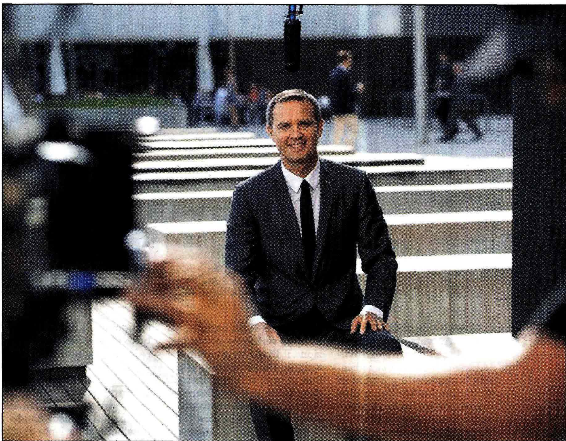
Sopra un'immagine di backstage scattata sul set durante le riprese dello spot pubblicitario che è stato girato a Barcellona lo scorso ottobre e che vede come protagonista Massimo Doris, amministratore delegato di Banca Mediolanum ed alcuni fermi immagine dello spot stesso

Se è vero che grazie ad esempio ai conti correnti di casa Mediolanum è possibile entrare virtualmente in banca e compiere le operazioni desiderate 24 ore su 24, 7 giorni su 7 attraverso Internet, è altrettanto vero che il gruppo di Basiglio ha sviluppato nel corso degli anni, in maniera innovativa, altri strumenti ef-