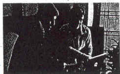
I Family Banker, consulenza di fiducia

fine giugno su giornali e Internet, per raggiungere, e chiamarli a raccolta». Nel primo caso, è Ennio Doris in persona, fondatore e presidente del Gruppo Mediolanum, a rivolgersi direttamente ai professionisti del settore bancario, per dirgli: anch'io in passato ho lavorato in una banca tradizionale, e ho voluto cambiare, e ho cambiato il modello e il modo di fare banca, il modo di fare questa professione. Conosciamo bene l'importanza di essere un punto di riferimento per il cliente, ti propongo di lavorare in un diverso modello di banca, in Mediolanum sei tu la banca per il tuo cliente. E noi ti mettiamo a disposizione tutti gli strumenti necessari per avere successo e fare un ulteriore percorso di carriera. Ed è un'opportunità concreta rivolta anche a chi svolge un lavoro dipendente in un settore di attività diverso