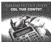
La locandina dell'evento.

Appuntamento sabato 30 gennaio nei 250 Family Banker Office di tutta Italia per "fare i conti col tuo conto", cioè per sapere esattamente quanto il tuo conto corrente rende e quanto ti costa, e confrontarlo con il conto corrente Freedom. L'appuntamento è un'occasione, per i non-clienti della Banca, anche per sperimentare lo stile Mediolanum nei rapporti fra Banca e cliente. Per sapere l'ora di inizio e termine dell'iniziativa contattare il Family Banker Of-