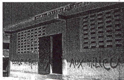
Da anni la Fondazione Mediolanum opera ad Haiti a sostegno dell'infanzia. Qui sopra, una delle scuole realizzate

fice più vicino (numeri di telefono sull'elenco e sul sito www.bancamediolanum.it ).