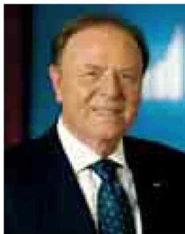
Ennio Doris spiega il successo di un modello che è riuscito a battere la crisi

M ediolanum non sente la crisi e archivia il 2012 con risultati mai visti prima. L'utile netto si è più che quadruplicato raggiungendo quota 351 milioni di euro (+422%) mentre le masse gestite e amministrati sono cresciute del 12% a 51,6 miliardi. Il tutto con un ritorno agli azionisti di 18 centesimi per azione (0,10 cent dei quali già distribuiti a novembre a titolo di acconto)*.