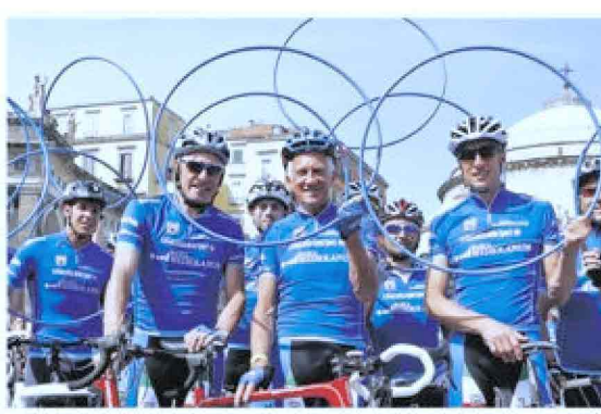
Da sinistra Moser, Motta e Fondriest, storici testimonial Mediolanum al Giro

Per il tredicesimo anno consecutivo Banca Mediolanum è salita in sella prendendo parte alla 98esima edizione del Giro d'Italia, partenza da Sanremo il 9 maggio. E lo ha fatto ancora una volta come sponsor del Gran Premio della Montagna con la maglia azzurra, dedicata al miglior "scalatore", simbolo di italianità ma non solo: anche di impegno, sacrificio, e forza del singolo individuo ma allo stesso tempo della capacità di fare squadra e del lavoro di gruppo. Concetti in profonda sintonia con i valori e la filosofia sui quali poggia l'esperienza di Banca Mediolanum. Come sempre, anche per l'edizione 2015 la presenza di Banca Mediolanum al Giro d'Italia, che si concluderà a Milano il 31 maggio, sarà arricchita da pranzi esclusivi su invito lungo il percorso, cene di gala in location di eccezione, pedalate amatoriali e tante altre iniziative parallele alla manifestazione sportiva caratterizzate dalla presenza di testimonial d'eccezione tra i quali Francesco Moser (dal 2003), Gianni Motta (dal 2004), Maurizio Fondriest (dal 2004) e Paolo Bettini (dal 2010). Un insieme di eventi creati ad hoc che gli anni hanno attirato decine di migliaia di persone e che sono stati quotidianamente seguiti e documentati sui principali