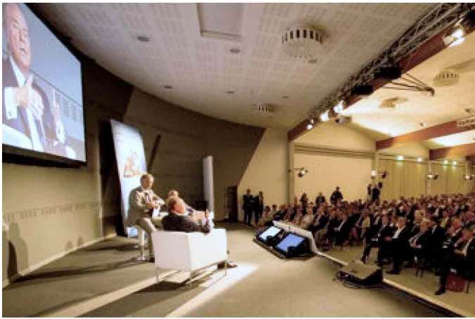
Una delle serate "Riparti Italia" che si sono svolte in tutta Italia con Ennio Doris

L'iniziativa in questione è Mediolanum Riparti Italia, l'offerta da parte di Banca Mediolanum, avviata nei mesi scorsi, di mutui a tassi vantaggiosi per realizzare e rendere possibili quei lavori di ristrutturazione delle proprie case e il rinnovo degli impianti domestici per una maggiore efficienza energetica, per i quali sono previsti anche gli incentivi fiscali dello Stato.