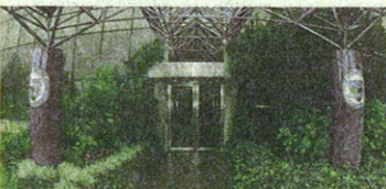
L'ingresso di Mediolanum Corporate University (MCU) a Milano

La conseguenza naturale è che le azioni saranno molto più remunerative delle obbligazioni. Dunque se vuoi investire col massimo profitto non aspettare che la ripresa avvenga, ti basti sapere che avverrà. Quanto alle crisi che infiammano il NordAfrica, Bob Doll ha dichiarato che «non dobbiamo temere un eccessivo rialzo del prezzo del petrolio. Se la Libia non dovesse fornire il suo milione e mezzo di barili al giorno, l'Arabia Saudita può aumentare la sua produzione fino a 4,5. I rincari di queste settimane sono dettati non da una emergenza reale ma dalla paura». Un invito a non abbandonarsi al panico condiviso da Ennio Doris, che così ha commentato: «Queste che io chiamo "rivoluzioni della consapevolezza" sono proteste profondamente democratiche, compiute nell'89, proprie degli averi dei diritti. Se in questi Paesi si affermano governi democratici, le ricadute benefiche si avranno per tutti anche in campo economico e finanziario».