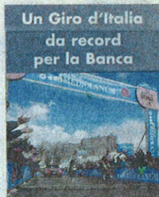
L'arrivo sulla Cima Coppi nel Gran premio della montagna

laureati di primo e secondo livello (laurea triennale o specialistica) di tutte le facoltà, che abbiano il desiderio e l'obiettivo di intraprendere la carriera del professionista finanziario (il Master non è vincolante alla carriera in Mediolanum ma ne costituisce titolo di pregio). L'inizio dei corsi è previsto per il prossimo novembre, per una durata di 12 mesi, e la scadenza per la domanda di ammissione è fissata al 30 settembre. L'accesso è a numero chiuso per un totale di 40 posti, è prevista una selezione attraverso test attitudinali e colloqui individuali. La graduatoria finale delle selezioni porterà anche all'assegnazione di alcune Borse di studio, messe a disposizione da Banca Mediolanum, a favore dei frequentanti più meritevoli.