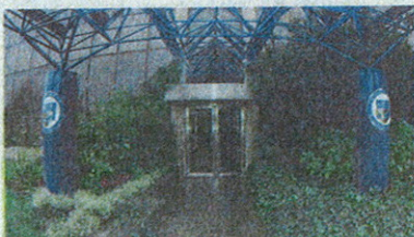
L'ingresso di Mediolanum Corporate University (MCU) a Milano.3

Con l'obiettivo di formare i Family Banker del futuro, i professionisti finanziari d'eccellenza, attraverso un percorso di studi di altissimo livello, dalla collaborazione tra il MIP - la Business School del Politecnico di Milano - e Mediolanum Corporate University (MCU) - l'università aziendale di Banca Mediolanum - nasce il Master Universitario in Family Banking. Si tratta di un vero e proprio Master universitario, della durata di 12 mesi, che rilascia un titolo di studio con valore legale. Metà delle 52 giornate d'aula previste si svolgeranno al MIP, l'altra metà in MCU a Milano, presso la sede di Banca Mediolanum, a cui si aggiungeranno le attività di affiancamento e formazione sul campo presso i Family Banker