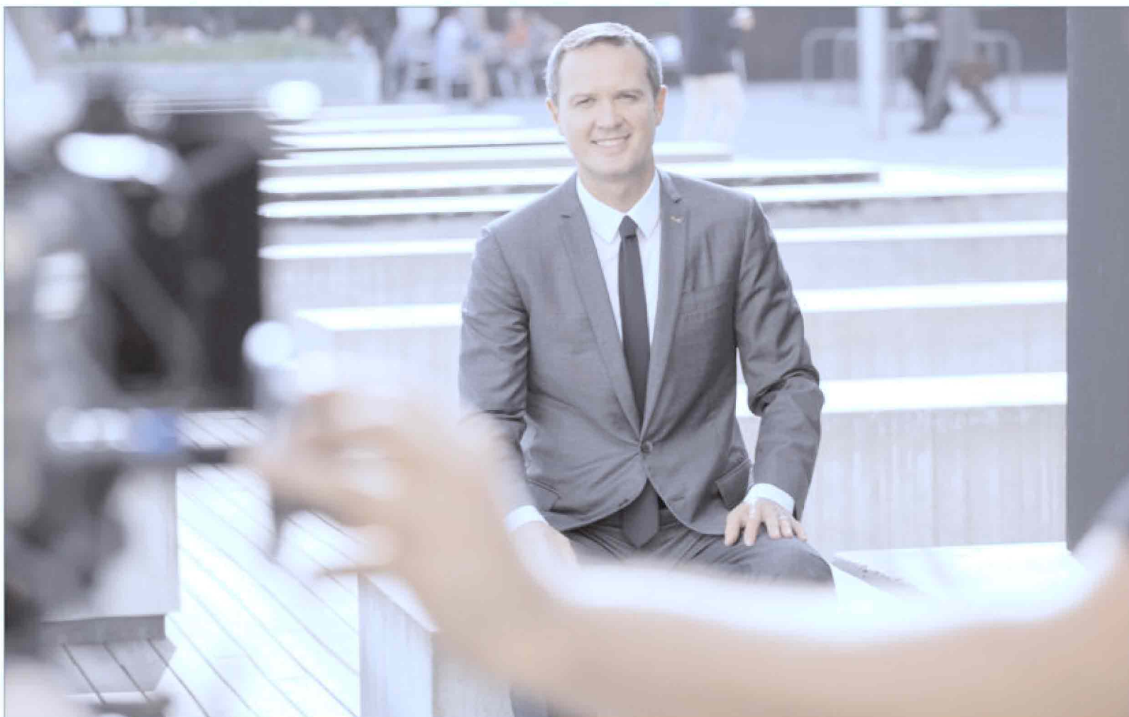
Sopra: un'immagine di backstage scattata sul set durante le riprese dello spot pubblicitario che è stato girato a Barcellona lo scorso ottobre e che vede come protagonista Massimo Doris, amministratore delegato di Banca Mediolanum. Sotto: alcuni fermi immagine dello spot stesso

Messaggio pubblicitario con finalità promozionale. La documentazione d'offerta dei prodotti e servizi distribuiti da Banca Mediolanum è disponibile sul sito www.bancamediolanum.it e presso gli Uffici dei Promotori Finanziari.