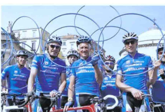
Da sinistra Moser, Motta e Fondriest, storici testimonial Mediolanum al Giro

Per il tredicesimo anno consecutivo Banca Mediolanum è salita in sella prendendo parte alla 98esima edizione del Giro d'Italia, partenza da Sanremo il 9 maggio. E lo ha fatto ancora una volta come sponsor del Gran Premio della Montagna con la maglia azzurra, dedicata al miglior "scalatore", simbolo di italianità ma non solo: anche di impegno, sacrificio, e forza del singolo individuo ma allo stesso tempo della capacità di fare squadra e del lavoro di gruppo. Concetti in profonda sintonia con i valori e la filosofia sui quali poggia l'esperienza di Banca Mediolanum. Come sempre, anche per l'edizione 2015 la presenza di Banca Mediolanum al Giro d'Italia, che si concluderà a Milano il 31 maggio, sarà arricchita da pranzi esclusivi su invito lungo il percorso, cene di gala in location di eccezione, pedalate amatoriali e tante altre iniziative parallele alla manifestazione sportiva caratterizzate dalla presenza di testimonial d'eccezione tra i quali Francesco Moser (dal 2003), Gianni Motta (dal 2004), Maurizio Fondriest (dal 2004) e Paolo Bettini (dal 2010). Un insieme di eventi creati ad hoc che gli anni hanno attirato decine di migliaia di persone e che sono stati quotidianamente seguiti e documentati sui principali