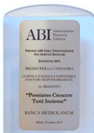
Il premio assegnato dall'ABI

Solamente nel corso del 2013, in seguito alle numerose alluvioni che hanno colpito diverse regioni italiane, Banca Mediolanum è intervenuta stanziando 1.600.000 euro a favore delle famiglie dei clienti e Family Banker che hanno subito danni. Oltre a ciò, sono state previste diverse agevolazioni tra le quali la possibilità di sospensione della rata mutui e prestiti per 12 mesi, l'attivazione di linee di credito privilegiate, la riduzione di un punto percentuale dello spread in essere su mutui e prestiti per 24 mesi e l'azzeramento