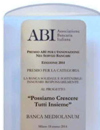
Il premio assegnato dall'ABI

Solamente nel corso del 2013, in seguito alle numerose alluvioni che hanno colpito diverse regioni italiane, Banca Mediolanum è intervenuta stanziando 1.600.000 euro a favore delle famiglie dei clienti e Family Banker che hanno subito danni. Oltre a ciò, sono state previste diverse agevolazioni tra le quali la possibilità di sospensione della rata mutui e prestiti per 12 mesi, l'attivazione di linee di credito privilegiate, la riduzione di un punto per-