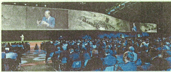
Un momento dell'evento di Rimini per i Family Banker Mediolanum

ai clienti un ulteriore modo di entrare in Banca con la semplicità, la chiarezza e la trasparenza di sempre. Con "accesso diretto" Banca Mediolanum conferma il suo ruolo di Banca innovativa e multicanale, capace di soddisfare le esigenze di un numero sempre maggiore di clienti, adattandosi ai loro comportamenti, stili di vita e modi di comunicare.