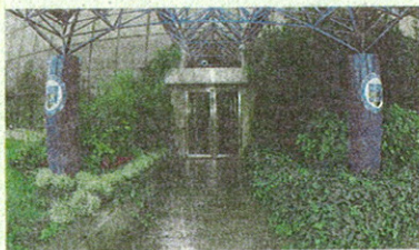
L'ingresso di Mediolanum Corporate University (MCU) a Milano