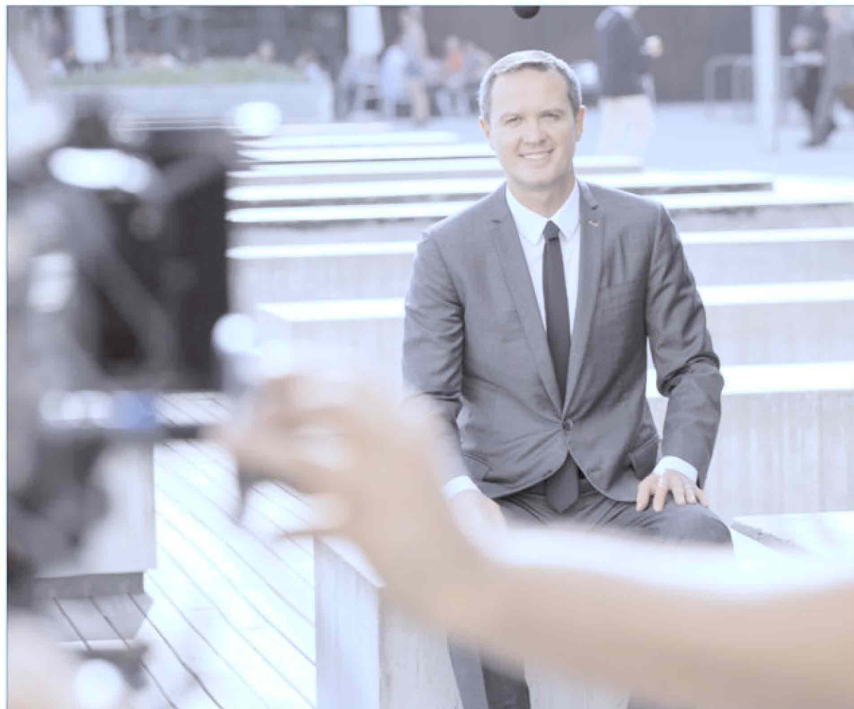
Sopra: un'immagine di backstage scattata sul set durante le riprese dello spot pubblicitario che è stato girato a Barcellona lo scorso ottobre e che vede come protagonista Massimo Doris, amministratore delegato di Banca Mediolanum ed alcuni fermi immagine dello spot stesso

Strumenti dunque versatili che consentono al cliente di muoversi e operare in massima libertà