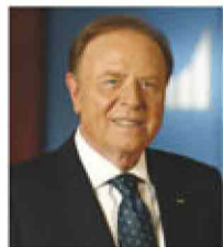
Ennio Doris spiega il successo di un modello che è riuscito a battere la crisi