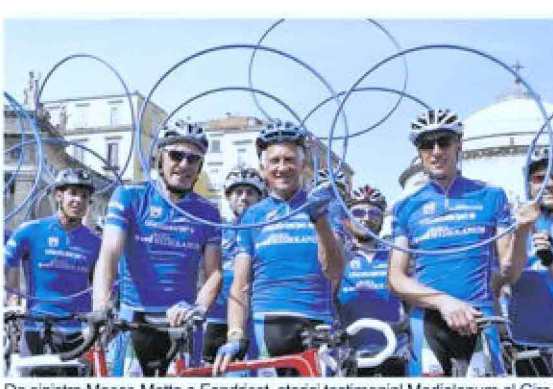
Da sinistra Moser, Motta e Fondriest, storici testimonial Mediolanum al Giro

Per il tredicesimo anno consecutivo Banca Mediolanum è salita in sella prendendo parte alla 98esima edizione del Giro d'Italia, partenza da Sanremo il 9 maggio. E lo ha fatto ancora una volta come sponsor del Gran Premio della Montagna con la maglia azzurra, dedicata al miglior "scalatore", simbolo di italianità ma non solo: anche di impegno, sacrificio, e forza del singolo individuo ma allo stesso tempo della capacità di fare squadra e del lavoro di gruppo. Concetti in profonda sintonia con i valori e la filosofia sui quali poggia l'esperienza di Banca Mediolanum. Come sempre, anche per l'edizione 2015 la presenza di Banca Mediolanum al Giro d'Italia, che si concluderà a Milano il 31 maggio, sarà arricchita da pranzi esclusivi su invito lungo il percorso, cene di gala in location di eccezione, pedalate amatoriali e tante altre iniziative parallele alla manifestazione sportiva caratterizzate dalla presenza di testimonial d'eccezione tra i quali Francesco Moser (dal 2003), Gianni Motta (dal 2004), Maurizio Fondriest (dal 2004) e Paolo Bettini (dal 2010). Un insieme di eventi creati ad hoc che gli anni hanno attirato decine di migliaia di persone e che sono stati quotidianamente seguiti e documentati sui principali