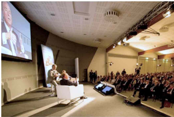
Una delle serate "Riparti Italia" che si sono svolte in tutta Italia con Ennio Doris

L'iniziativa in questione è Mediolanum Riparti Italia, l'offerta da parte di Banca Mediolanum, avviata nei mesi scorsi, di mutui a tassi vantaggiosi per realizzare e rendere possibili quei lavori di ristrutturazione delle proprie case e il rinnovo degli impianti domestici per una maggiore efficienza energetica, per i quali sono previsti anche gli incentivi fiscali dello Stato.